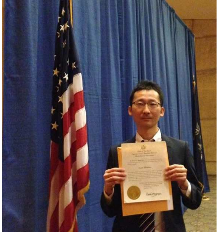
ニューヨーク州弁護士 宣誓式(2014年撮影)